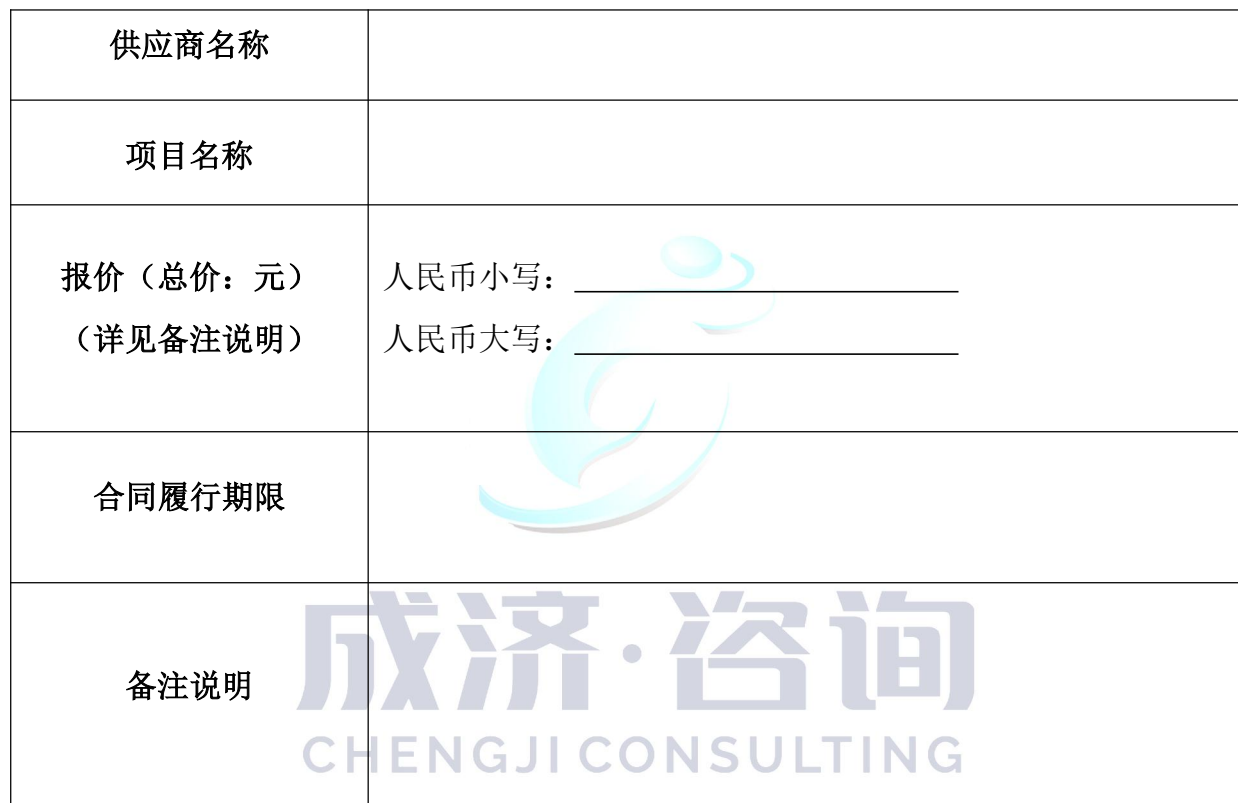
开标一览表（报价表）（单位均为人民币元）

按你方招标文件要求，我们，本投标文件签字方，谨此向你方发出要约如下：如你方接受本投标，我方承诺按照如下开标一览表（报价表）的价格完成（项目名称）【招标编号：（采购编号）】的实施。