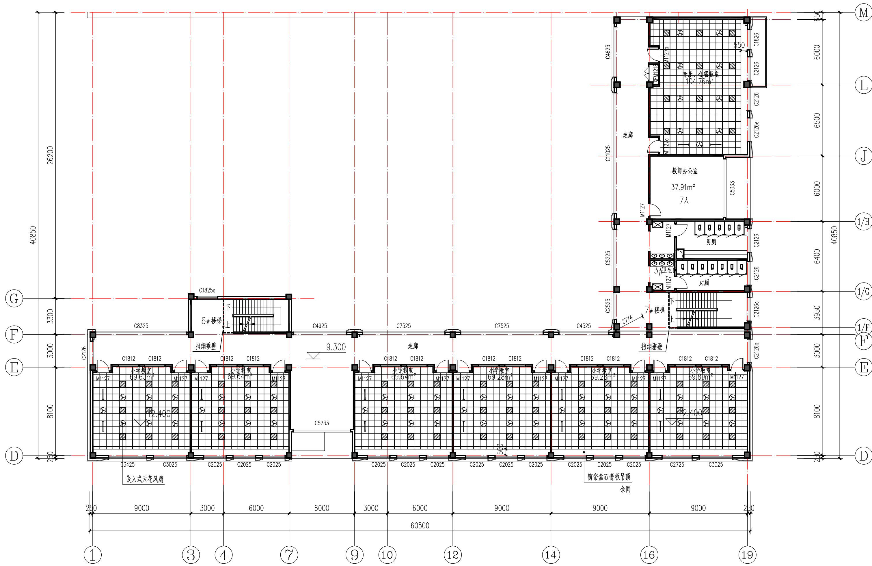
三层组合平面图 1:200 本层吊顶室内净面积522.12m 2 ,吊顶材料为硅钙板