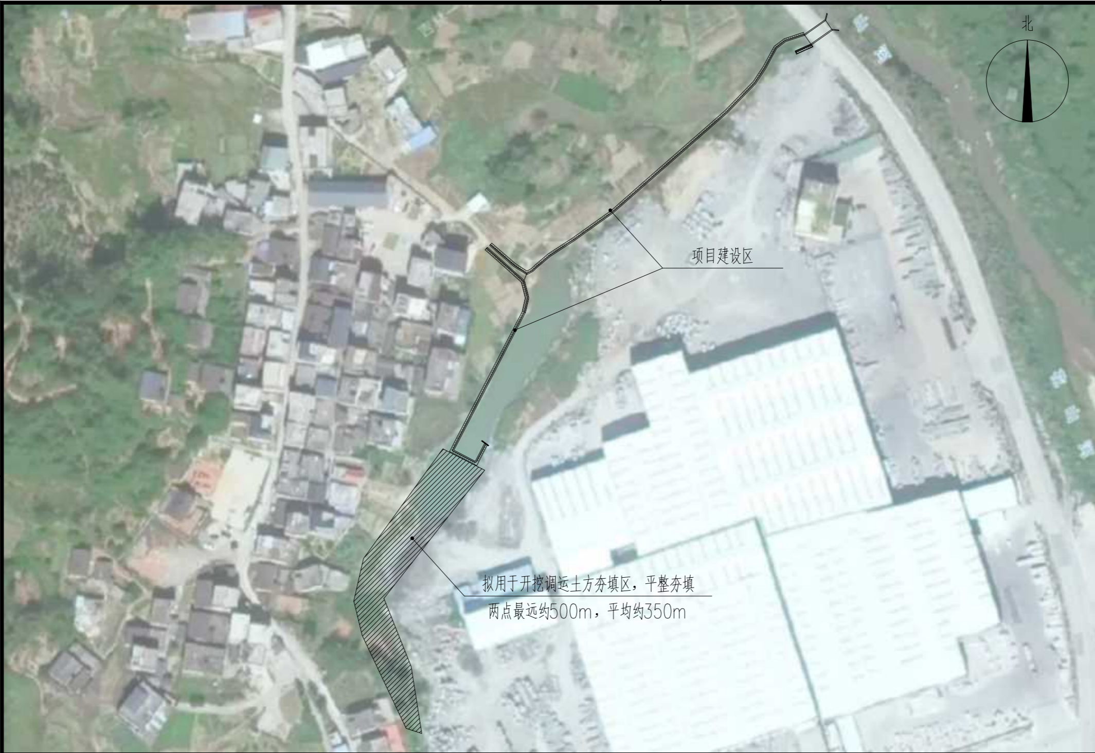
开挖土方调运示意图