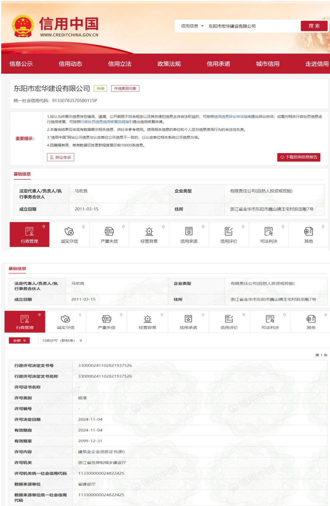
(6) 信用记录网络查询页面截图