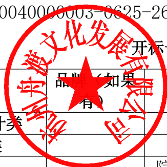
开标一览表（报价表）（单位均为人民币元）

按你方招标文件要求，我们，本投标文件签字方，谨此向你方发出要约如下：如你方接受本投标，我方承诺按照如下开标一览表（报价表）的价格完成中心标识标牌、导视系统及文化宣传视觉整体提升项目【项目编号：330108266110040000003-0625-26212325】的实施。