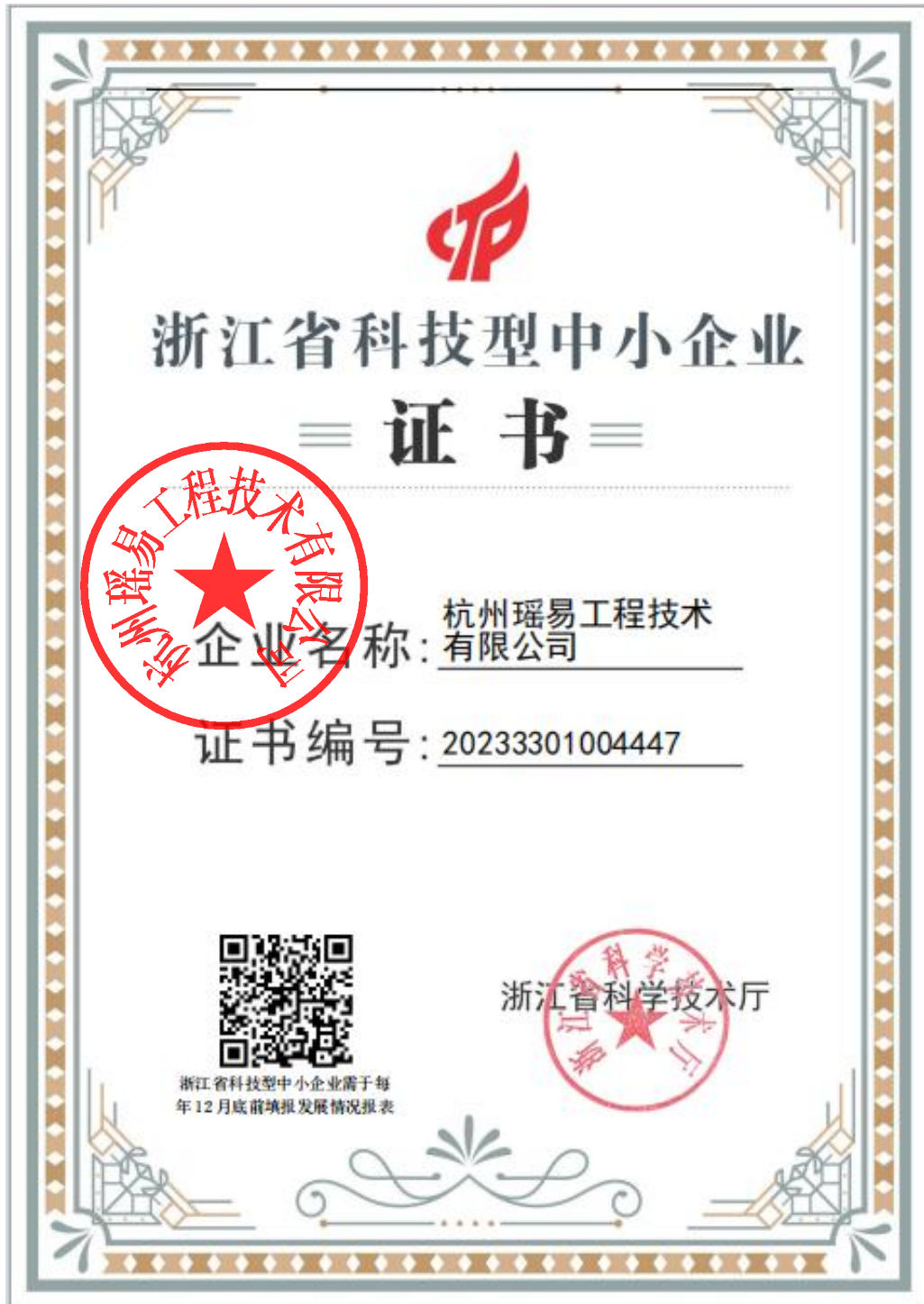
浙江省科技型中小企业证书