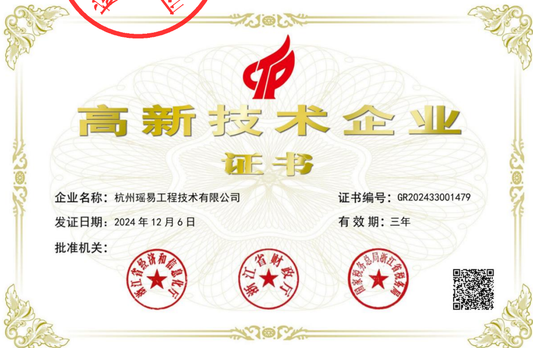
高新技术企业证书